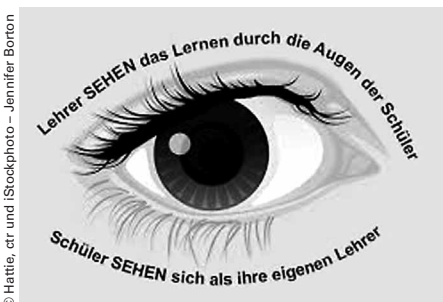
Das „Hattie-Auge“ des Visible Learning

Unterrichtsentwicklung, wie ich als Gymnasialdirektorin sie verstehe und anzu-