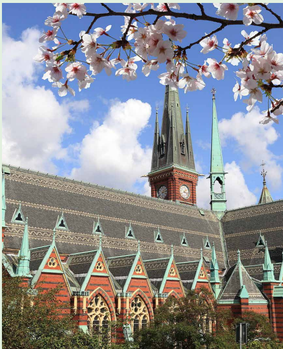
Oscar Fredriks Kyrka Göteborg