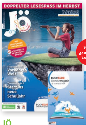
JÖ 5. + 6. Schulstufe

Jedes Abo mit 2 BUCHKLUB Literaturmagazinen