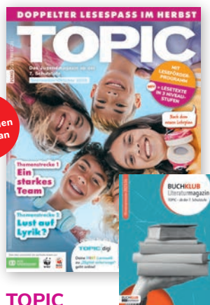
TOPIC 7. + 8. Schulstufe